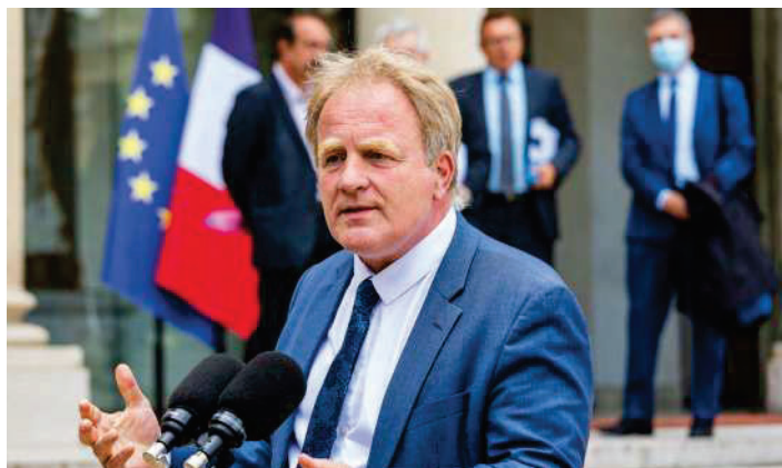
François Hommeril, président de la CFE-CGC, à l'Élysée (7 juillet 2021) lors d'un sommet social.

À L'OCCASION D'UNE TABLE RONDE D'ALTERNATIVES ÉCONOMIQUES SUR LA RÉFORME DES RETRAITES, FRANÇOIS HOMMERIL, PRÉSIDENT DE LA CFE-CGC , A BATTU EN BRÈCHE LES ARGUMENTS DE L'EXÉCUTIF.